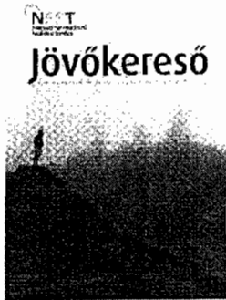
Jövőkereső az NFFT Jelentése a magyar Társadalomnak

Cím: Országgyűlés Irodaháza 1358 Budapest Széchenyi rakpart 19. Tel.: +36 1 441-6178, Fax: +36 1 441-6179, e-mail: nfft[kukac]parlament[pont]hu