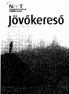
Jövőkereső az NFFT Jelentése a magyar Társadalomnak

Cím: Országgyűlés Irodaháza 1358 Budapest Széchenyi rakpart 19. Tel.: +36 1 441-6178, Fax: +36 1 441-6179, e-mail: nfft[kukac]parlament[pont]hu